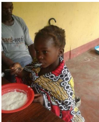
Dit meisje krijgt om de dag een maaltijd