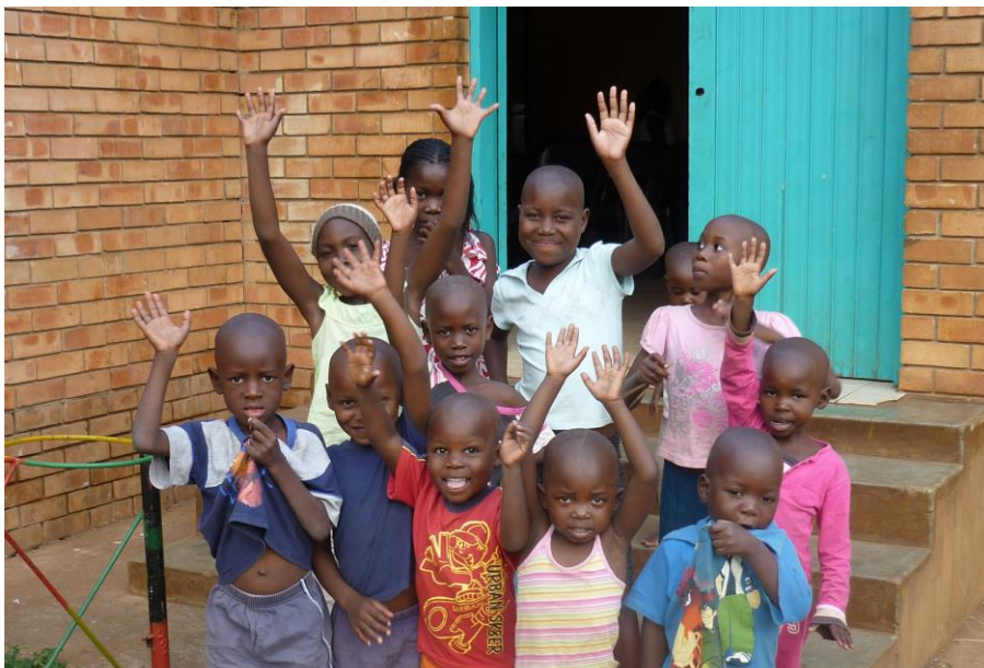
Foto: project ZAF051 richt zich op de kinderen die in kindertehuis Takalani in Zuid Afrika wonen. Zie het projectenoverzicht op pagina 3